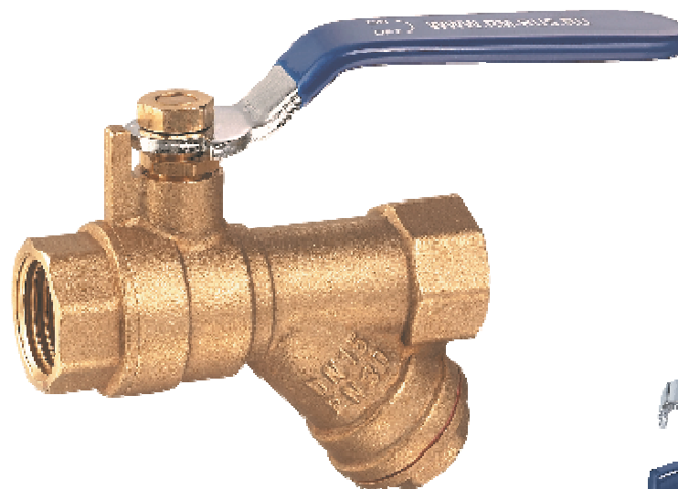
Кран шаровой с фильтром.