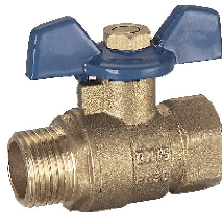
Кран шаровой гайка/штуцер (одна резьба внутренняя вторая наружная) бабочка