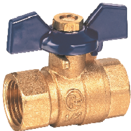
Кран шаровой гайка/гайка (обе резьбы внутренние) бабочка